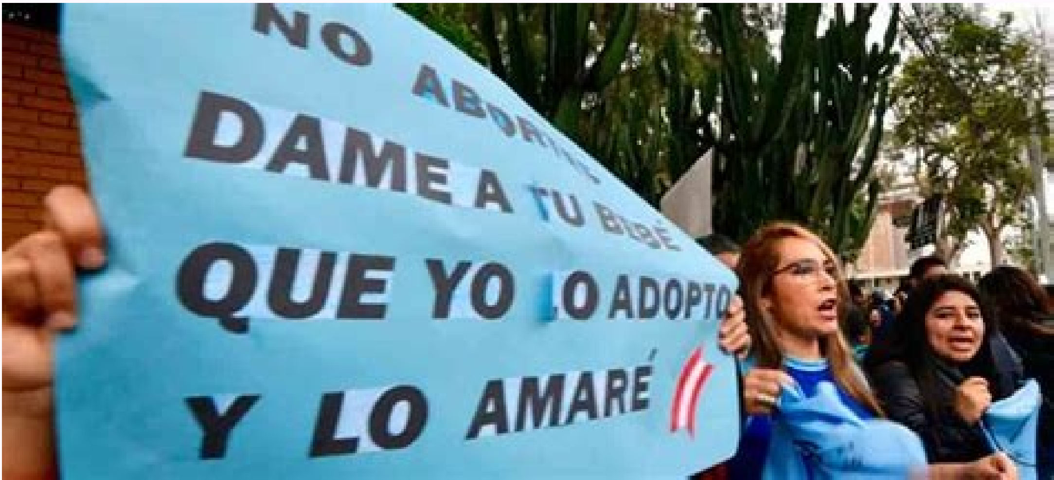
Proyecto de ley aborto argentina 2019 pdf.